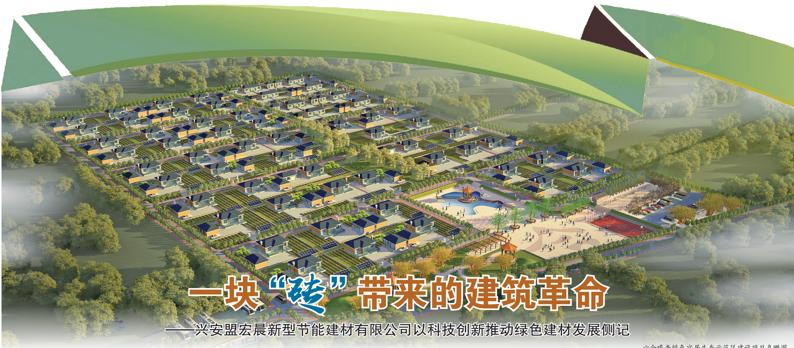
六合嘎查绿色宜居生态示范区建设项目鸟瞰图