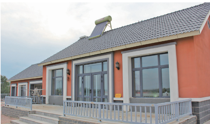
六合嘎查节能民居