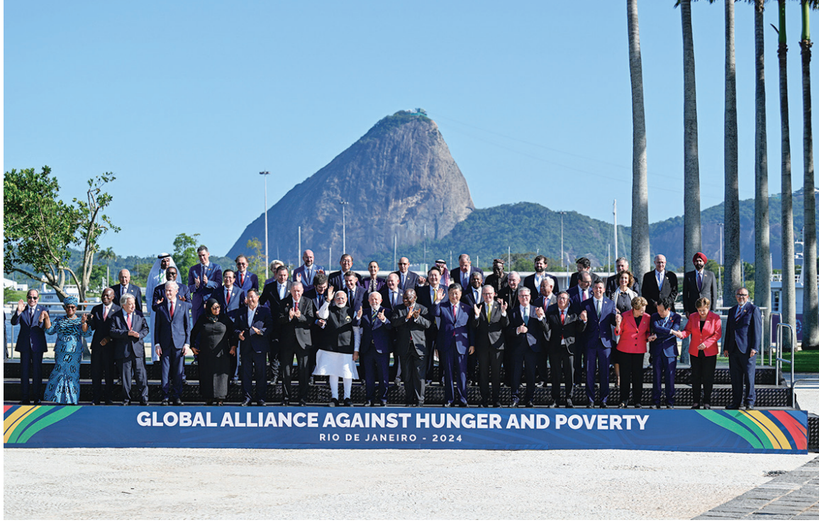
当地时间11月18日上午,国家主席习近平在巴西里约热内卢出席二十国集团领导人第十九次峰会。峰会把“构建公正的世界和可持续的星球”作为主题,并决定成立“抗击饥饿与贫困全球联盟”。这是习近平与会领导人共同参加巴方发起的“抗击饥饿与贫困全球联盟”合影。